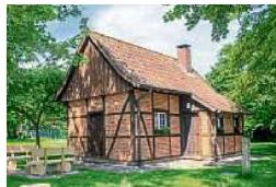
Ziel der Tour ist das Rinkeroder Backhaus

Gestartet wird am Samstag, um 11 Uhr am Kasten des Heimatvereins gegenüber dem Haupteingang der Volksbank. „Jörg Peiler hat eine sehr interessante Tour nach Rinkerode und wieder zurück nach Sendenhorst ausgearbeitet“, heißt es in der Ankündigung. Die Route selbst ist etwa 35 Kilometer lang. Die Führung wird etwa eine gute Stunde